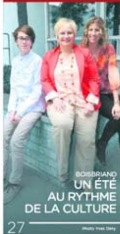
BOSSERIANO UN ÉTÉ AU RYTHME DE LA CULTURE